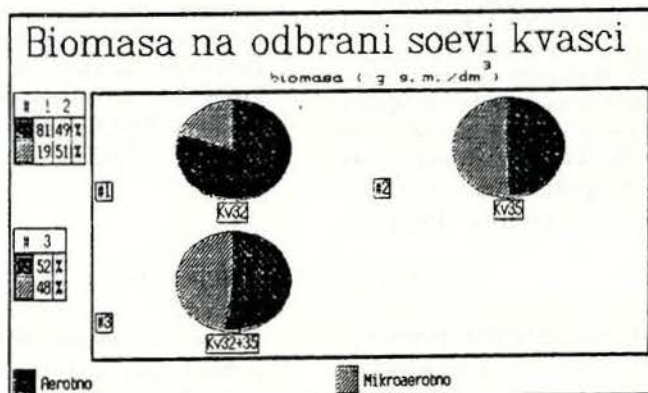
Слика 1. Количество на биомаса на одбраните севи квасци, култивирани на треселица при 30°C, за време од 48 часа на филтрат збогатен со 0,5% гликоза

на Сл. 1, по својата продуктивност сојот Kv-32 ( Saccharomyces rouxii ) се издвојуваше од останатите пет испитувани квасци и за истиот инкубационен период, прирастот на биомаса ја достигна вредноста од 13,8 г дм -3